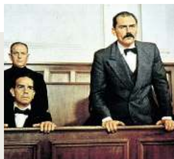
SACCO E VANZETTI Film memorabile sull'ingiusta condanna a morte dei due anarchici italiani in America

GIORDANO BRUNO Un grandissimo Volontè interpreta il monaco campano cinquecentesco