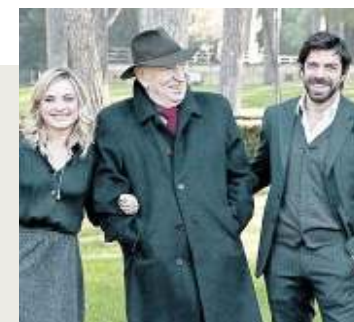
L'INDUSTRIALE Una storia cupa sull'azzardo dell'avidità nella sua ultima regia con Favino e Crescentini

TUTTO QUELLO CHE VUOI Nel delizioso film di Bruni, Montaldo interpreta il ruolo di un poeta smemorato