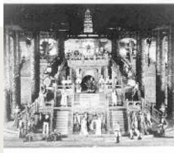
LIRICA E DINTORNI Non solo regie per Montaldo, ma anche allestimenti di opere liriche di pregio

Domenica 9 Luglio 2017 www.ilmessaggero.it