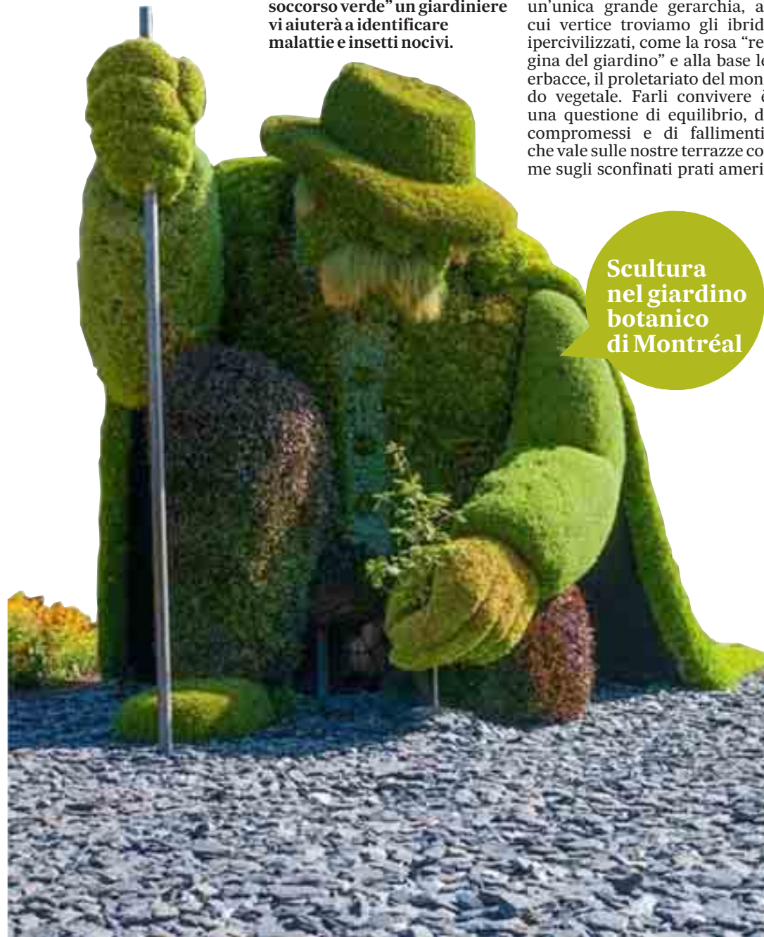
Scultura nel giardino botanico di Montréal