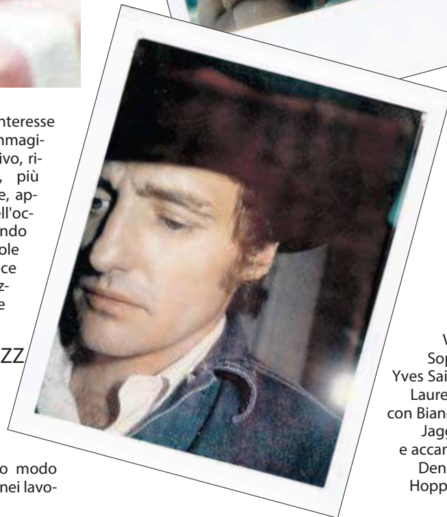
VOLTI Sopra Yves Saint Laurent con Bianca Jagger e accanto Dennis Hopper