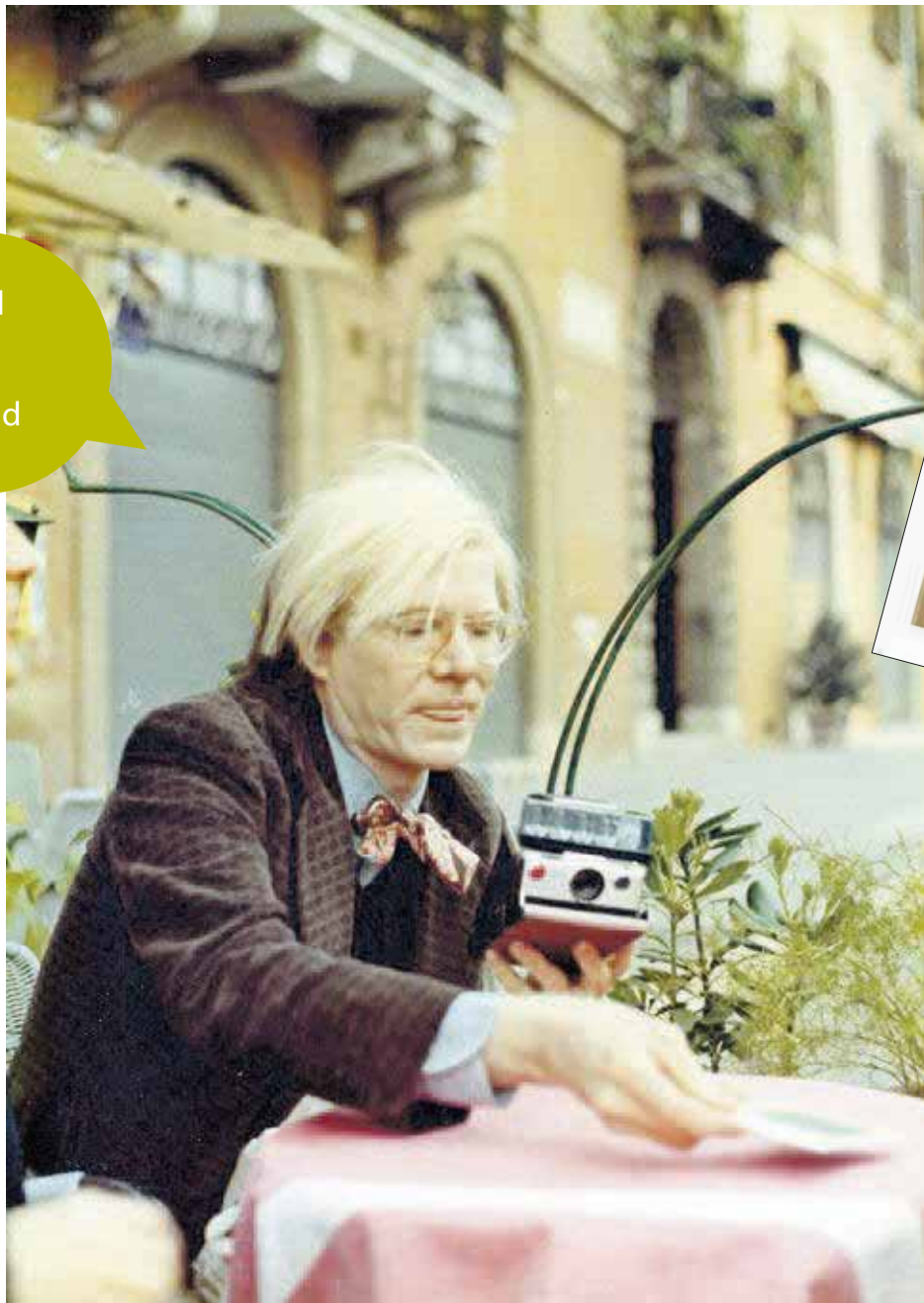
Warhol nel '72 con la Polaroid

YVES SAINT LAURENT RIPRESO MENTRE FA IL MODELLO. BASQUIAT ANNOIATO E JACK NICHOLSON A BOCCA APERTA